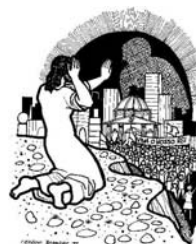
1º Domingo Cuaresma