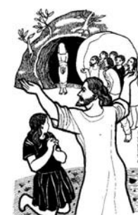
5º Domingo Cuaresma