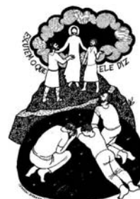
2º Domingo Cuaresma