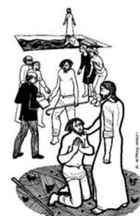
4º Domingo Cuaresma