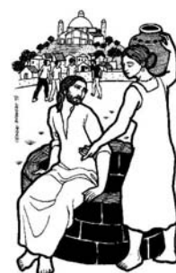
3º Domingo Cuaresma